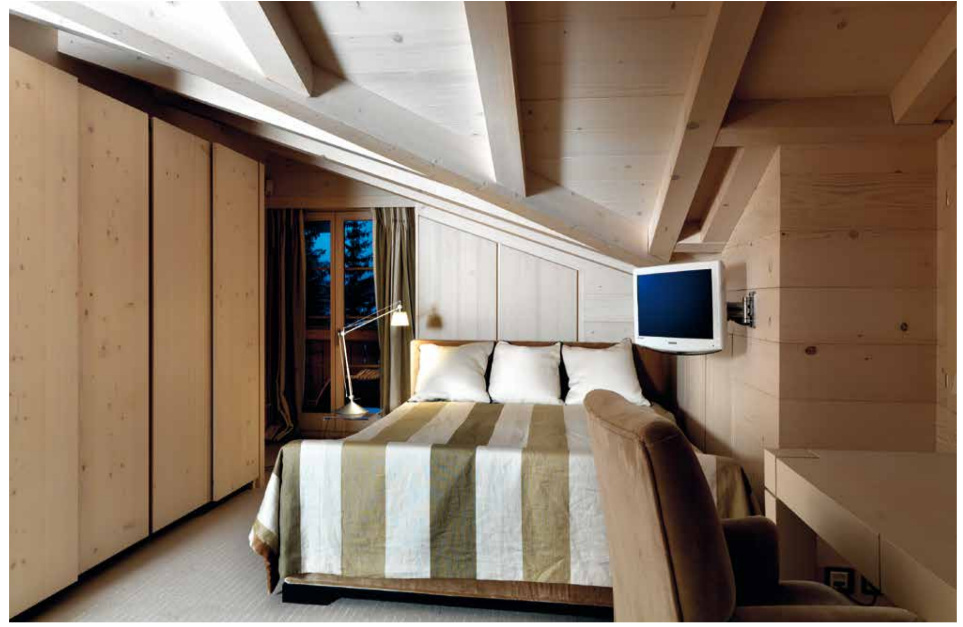
Üst katta, yapının geri kalan bölümünde tercih edilen koyu tonlardaki ahşabın tersine, ahşap kaplamalar ve halılar çok daha açık tonlarda tercih edilmiş. Beyazdan, güvercin grisine uzanan bir renk paletini de yeni 'Alp stili'ne katılan yepyeni bir yorum olarak değerlendirebiliriz.