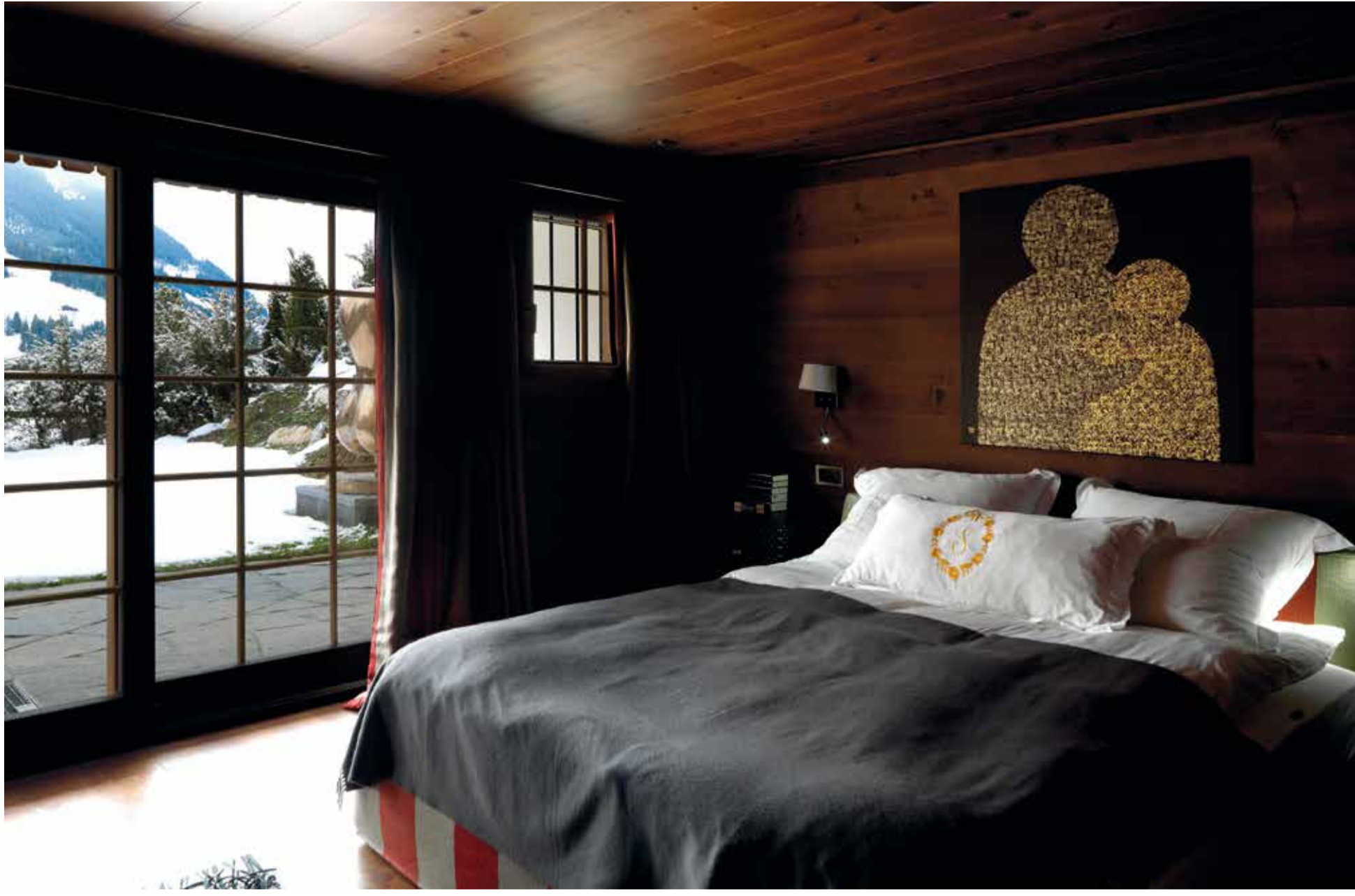
Luchinat, gereksiz bulduğu tüm mimari unsurlardan kurtularak ve temel haline döndürerek işe başlamış. Dış mekanda uçsuz bucaksız dağlardan oluşan sahneyi destekleyen ve onunla uyum içinde olan renk ve dokuları tercih ettiği materyallerle detaylar yaratarak devam etmiş.